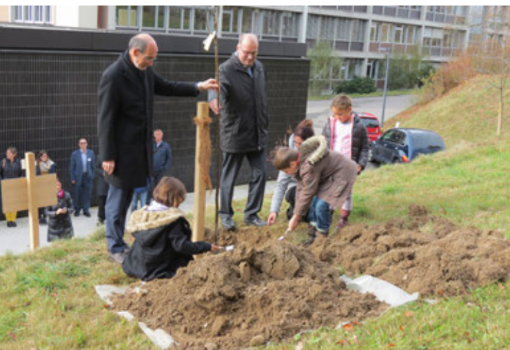
Giornata PER: un gruppo di bambini pianta simbolicamente un melo, assieme al presidente e al direttore dell'USC.

Con le sue emissioni, l'agricoltura concorre ai mutamenti climatici e, nel contempo, ne subisce direttamente le conseguenze. L'USC, pertanto, è in linea di massima disposta ad appoggiare la politica climatica della Confederazione, ma preferirebbe che gli obiettivi fossero perseguiti non con interventi finanziari, limitazioni o divieti, bensì mediante provvedimenti volontari.