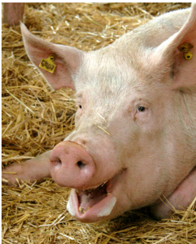
Nel 2016, un mercato della carne suina in leggera ripresa.

vendemmia è stata di qualità eccezionale, con quantità superiori a quelle degli ultimi tre anni.