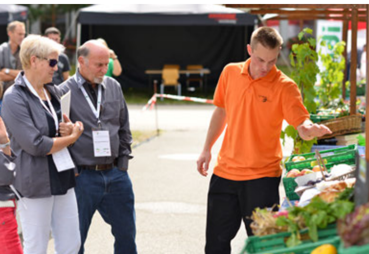
Un concorrente di AgriSkills spiega agli esperti come presentare i prodotti nel migliore dei modi.

Le risorse di Agristat sono confluite in larga misura nella preparazione e nella pubblicazione di dati statistici sull'agricoltura. Alcune statistiche sono state estese, così da essere pubblicate da EUROSTAT, corredate di un paragone con altri paesi. La revisione dell'indice dei prezzi alla produzione è stata portata a termine, ed è stata avviata quella dell'indice dei prezzi d'acquisto. Agristat ha inoltre eseguito per la prima volta l'intero calcolo del tasso Swissness di autoapprovvigionamento per le materie prime secondo le indicazioni fornite dall'UFAG, ricorrendo come base statistica al bilancio alimentare della Svizzera. Ha infine seguito diversi progetti di banca dati per clienti interni ed esterni, in particolare Agriprof, Agora e Proviande.