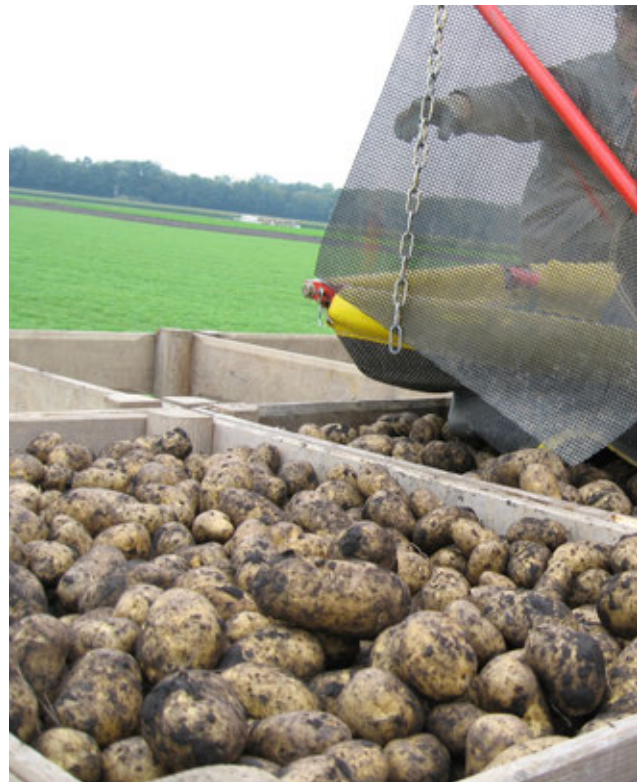
Il raccolto di patate ha subito le conseguenze di condizioni meteo estreme.

più rispetto allo stesso mese del 2015. I viticoltori hanno dovuto sorvegliare da vicino la drososifila per evitare danni maggiori ma, grazie a un autunno ideale, l'aroma delle uve è stato all'altezza. La