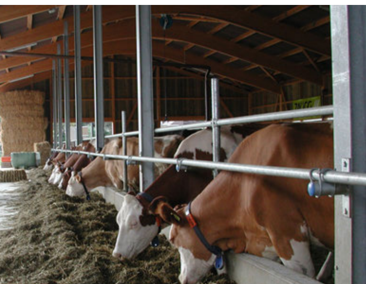
Anche nel 2017 l'USC non perderà di vista i prezzi del latte.

Le Camere hanno prorogato la moratoria sulla tecnologia genetica, proteggendo così l'agricoltura svizzera anche nei prossimi anni. Sia il Nazionale sia gli Stati, inoltre, si sono pronunciati a favore di una migliore etichettatura dei prodotti agricoli svizzeri, che in futuro po-