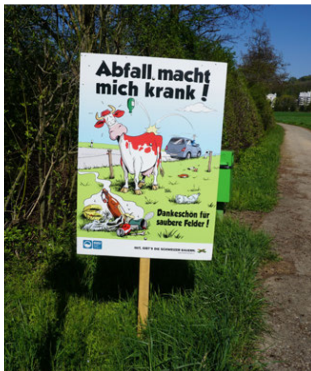
2016: quarto round per la campagna contro i rifiuti abbandonati nelle zone agricole.

Lo stand della campagna «Grazie, contadini svizzeri», al quale nel 2016 è stato aggiunto un modulo da impiegare all'aperto, ha partecipato a ben 49 fiere e saloni. Sulla rete televisiva www.buuretv.ch sono stati pubblicati 21 nuovi video, la pagina Facebook conta 700 fan in più (siamo così saliti a quota 13700) e al portale di vendita diretta «Dalla campagna» hanno aderito numerose nuove aziende, che hanno superato la soglia 1800. Circa 360 fattorie di tutto il paese