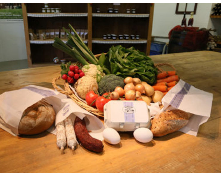
La gamma di imballaggi «Dalla campagna» mette in bella luce ogni prodotto.

La collaborazione nell'ambito IT tra le società Agrisano e l'USC si è conclusa nel giugno 2016. Per il primo semestre del 2016, i servizi di IT hanno offerto il loro supporto tecnico alle sedi di Brugg, Windisch e Berna.