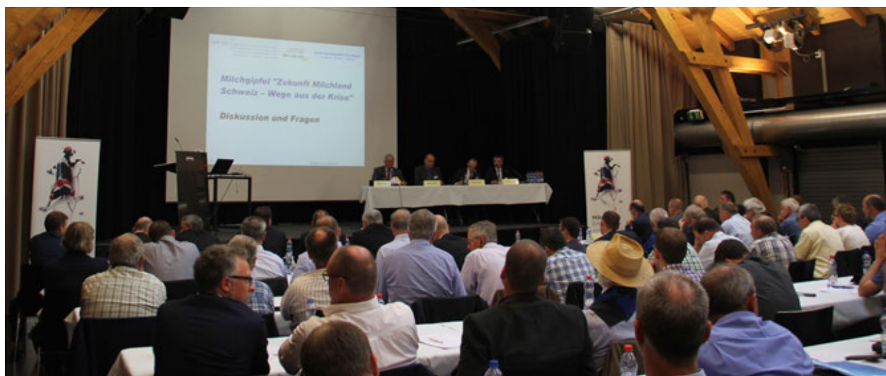
La brutta situazione sul mercato del latte ha spinto USC, PSL e IP Latte a convocare una riunione di crisi.

Al fianco di Coop, l'USC ha continuato questo progetto anche nel 2016, con il marchio Pro Montagna. Tutti gli agnelli inizialmente annunciati sono stati forniti. Il programma ha contribuito a mantenere i prezzi a un buon livello anche quest'anno.